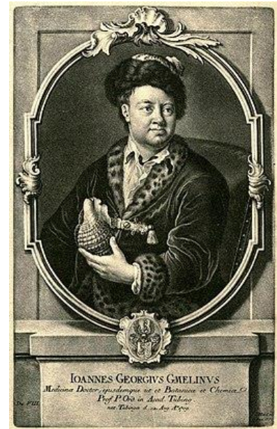
Johannes Georgius Gmelin (1709 - 1755)