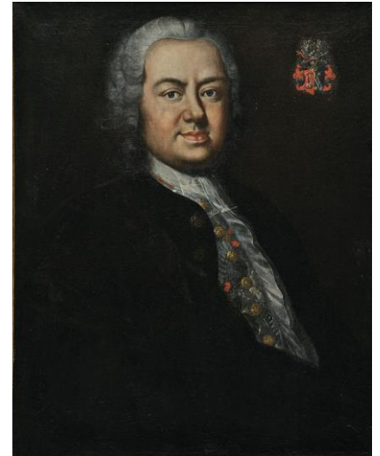
Johann Georg Gmelin (1709 - 1755)