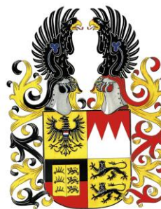
Schwäbisch Hall/ Lelystad © 15. November 2021.